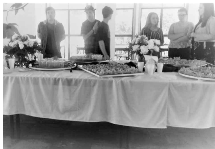
Lanche oferecido pelos alunos e professor do 11º E